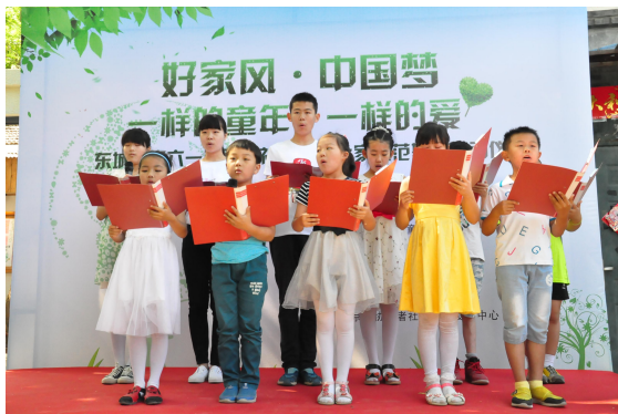
协作者童缘历年培育起来的儿童志愿者分享他们的成长和收获