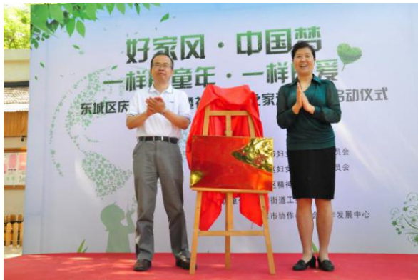
“协作者童缘”东四中心作为北京市首个社区儿童之家示范基地赢得多方关注，市区领导为童缘揭牌。

回到眼前，就是5月29日，在国际儿童节来临之际，东城区妇联和北京协作者联合举办“好家风·中国梦”“一样的童年·一样的爱——北京市社区儿童之家示范基地启动仪式暨庆六一活动”，正式宣布北京市首个“社区儿童之家示范基地”成立，希望通过各级妇联和社区儿童家长的参与，传递社区儿童之家的社会价值，倡导社会各界关注和支持儿童社区教育服务。