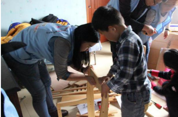
小洋加入志愿者姐姐安装的队伍中