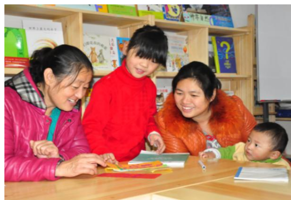
社区的家长和儿童在协作者童缘一同参与亲子活动，家长说“再也不用担心孩子冬天受冻了”