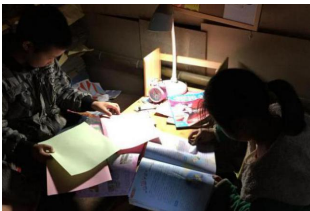
君君和哥哥在新的学习角看书，家里仅有5本书