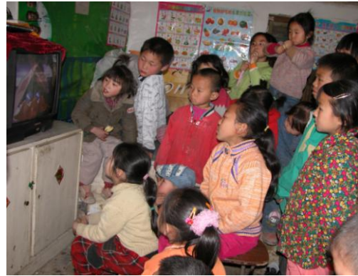
下雨了，我们就到孩子们的家里，没有电脑，没有投影仪，社会工作者最早的音频设备是一个打工居民家里的电视机