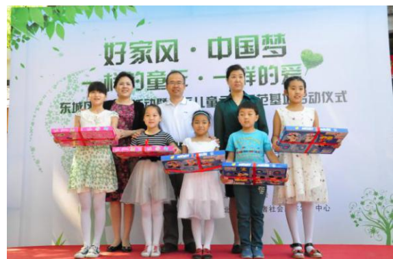
市区领导为社区儿童赠送节日礼物，童缘得到了来自政府、企业、基金会等社会各界的关注和支持。在这里的孩子该是多幸福啊