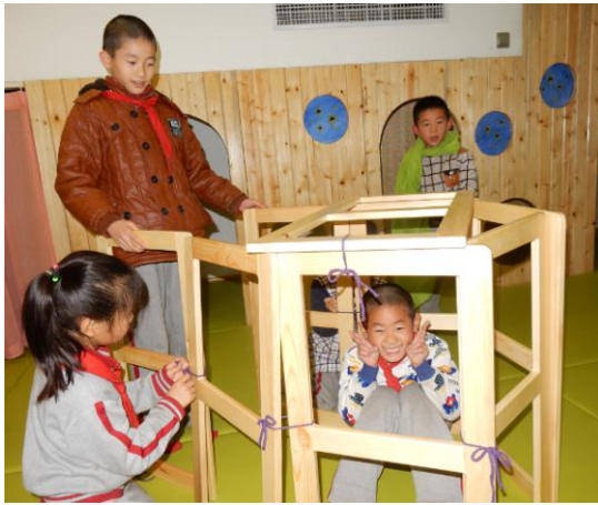
孩子们喜欢玩具，我们将流动玩具柜打造成“娃娃屋”，让孩子的想象力得到更充分的发挥。