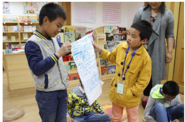
南京协作者童缘组织开展社区调查活动，在参与中锻炼儿童的观察能力、分析能力