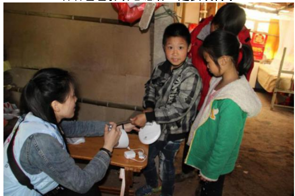
看到台灯，君君哥哥显得很兴奋，君君依旧不讲话