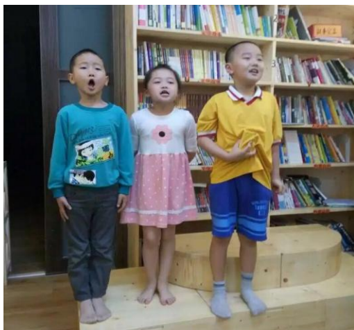
珠海协作者童缘里的孩子演练小歌谣