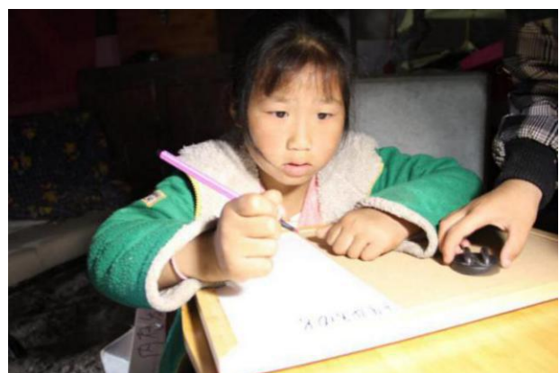
君君尝试写下学习角的名字“学习天地”

截止2016年5月22日下午17:00，南京协作者首批“一平米读书角改造计划”完成了12个困境流动儿童学习角的改造。后续，南京协作者也将持续为有需要的儿童建设图书