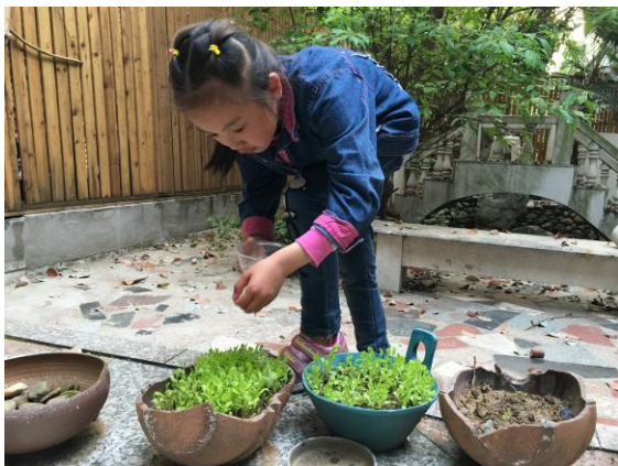
南京协作者童缘的孩子们种植绿植，感悟生命的成长

这样的童缘，协作者团队除在北京正式建立了三个，南京、珠海也分别是各一个，现在看下他们的服务：