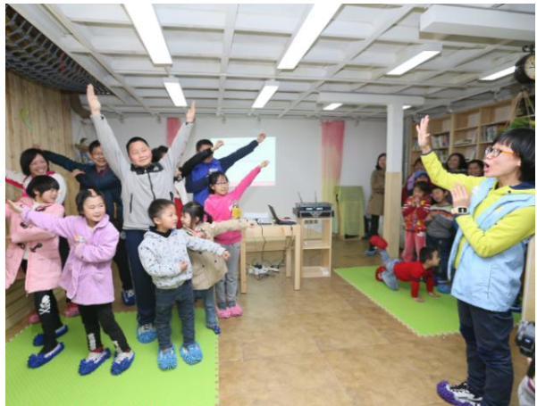
曾经我们在打工朋友家中，在露天的菜地马路边、在废弃的仓库里、在大树下为孩子们开展活动，如今我们让孩子可以享受最优雅的服务，体会多媒体带来的新科技，让新风系统为孩子过滤掉尘霾。