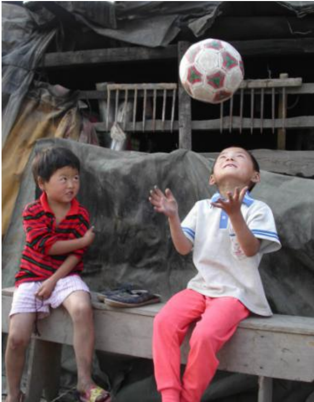
一个捡来的皮球，一份捡来的快乐