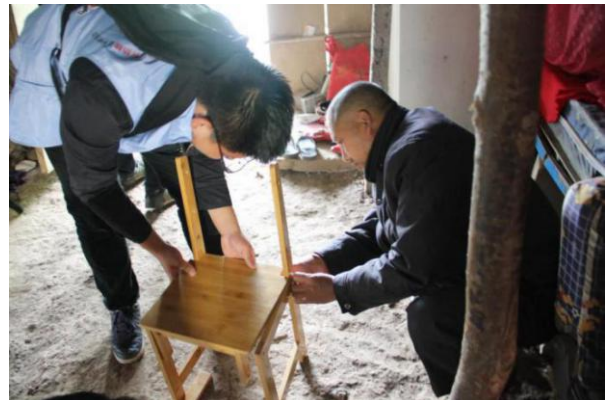
君君爸爸协助志愿者一起安装椅子