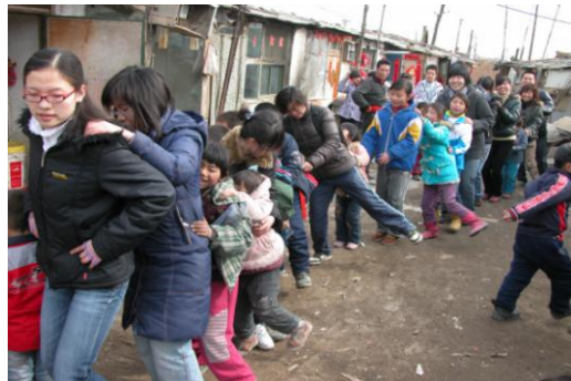
在狭小的棚户区空地上，社会工作者的到来，让社区的居民、孩子融入一起

为什么要在社区里面打造社区儿童之家的一个根本的目的，是我们希望儿童在这里不仅可以完成作业，而且能够在一个放松的、尊重的、友好的环境下学会跟同伴之间，家庭之间，社区之间有一个交往，成为最好的自己、最好的家人、最好的邻居、最好的公民，为儿童建立自然、简约、优雅的综合性儿童之家，让每个孩子都享受最好的服务。