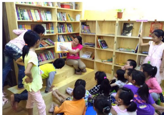
珠海协作者童缘的宝贝读书会每次都吸引众多儿童的参与：