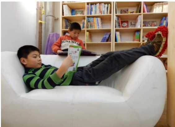
那个流动爱心图书角如今已打造为孩子们最喜欢的爱心图书室，用最舒服的姿势阅读书籍